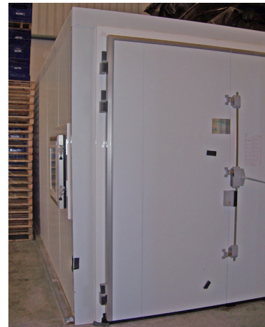
Cámara de tratamiento de 30.000 kg de caquis

Región Nordeste: Bailén, 105 - 08009 BARCELONA Tel. Call Center: 902 426 462 - Fax: 902 091 872 e-mail: ccenternordeste@es.linde-gas.com