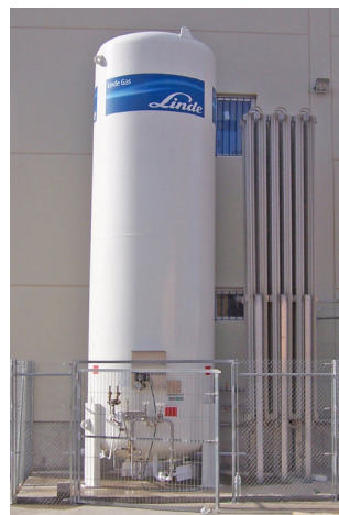
← Depósito criogénico de BIOGON® C

Abelló Linde, S.A le ofrece su experiencia y equipo profesional para conseguir un tratamiento del caqui altamente rentable y completamente satisfactorio y que podemos adaptar a sus necesidades.